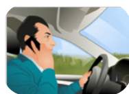
Le risque routier