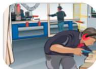
Le risque bruit