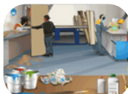
Le risque chimique