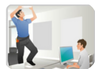
Gérer la sous-traitance