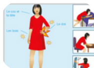
Le risque TMS