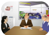
L'évaluation des risques