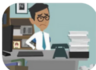
Les risques psychosociaux